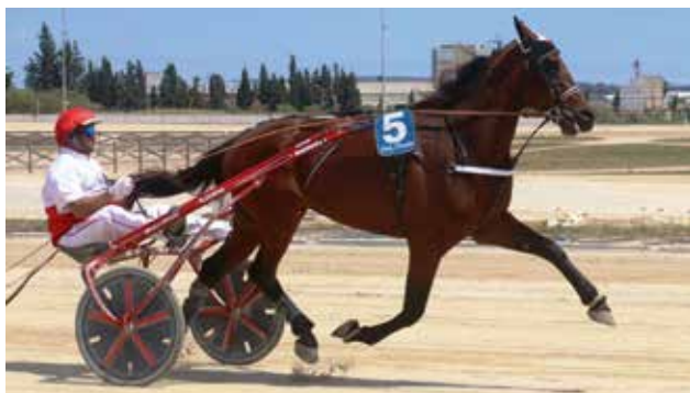
1 KIWI DURAN (Cuadra Ca'n Duran)