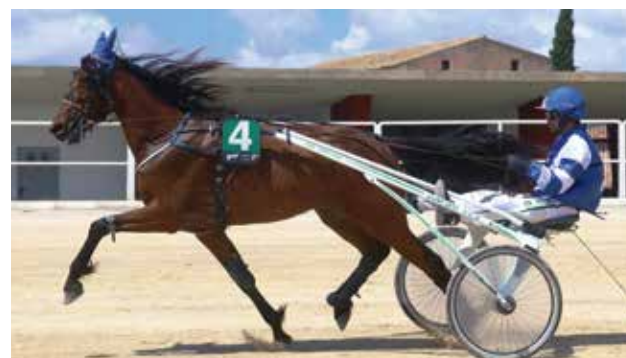
6 KALENJI PLA RIB (Cuadra Can Cala)