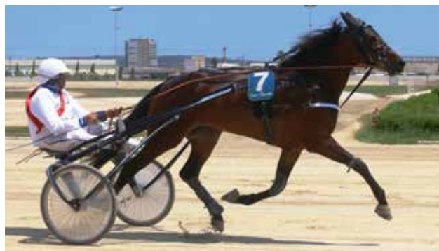
2 KARAMBOLA VX (Cuadra Sa Corbaia Vx)