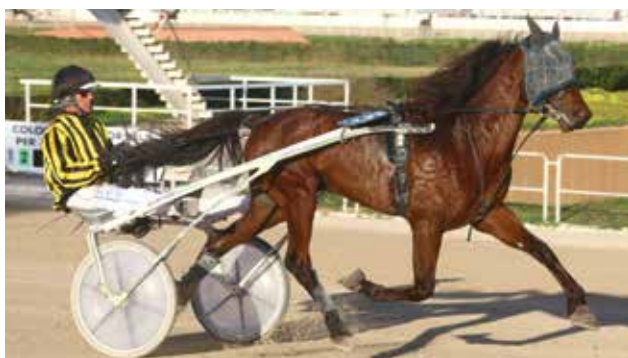
7 KAOS (Cuadra Veloz)