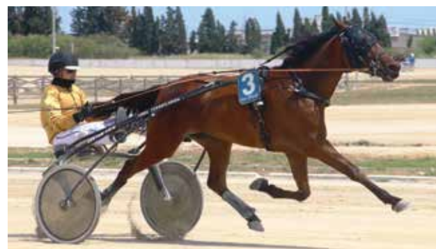
8 KAMILA DE FONT (Cuadra Torreflorida)