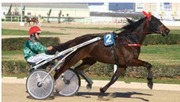
5 KASTA MAKER SB (Cuadra Ses Barrioles)